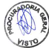
Tauillo Tezelli Prefeito Municipal

PAÇO MUNICIPAL "10 DE OUTUBRO" Campo Mourão, 05 de outubro de 2023