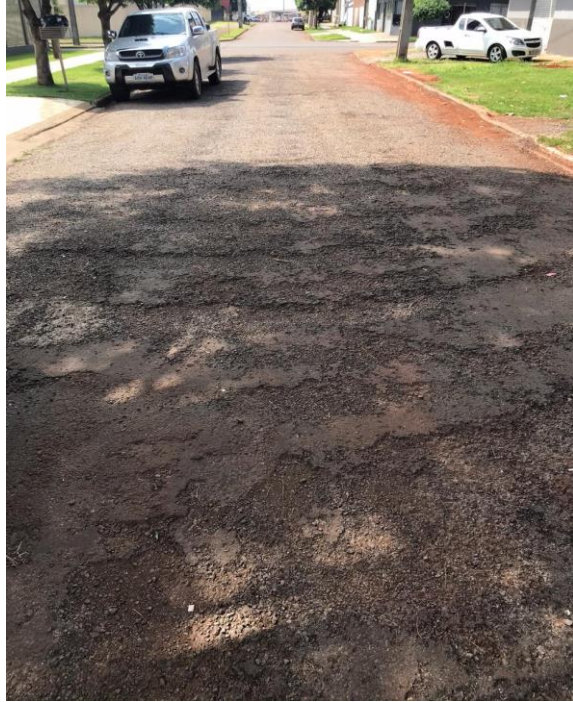
Rua Alcides Ferreira Toledo