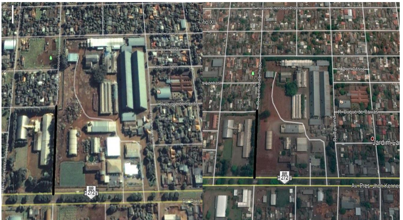
Imagem de 2003 a 2018 identificando a ausência de construção no local onde a Rua Lemos do Prado passava.