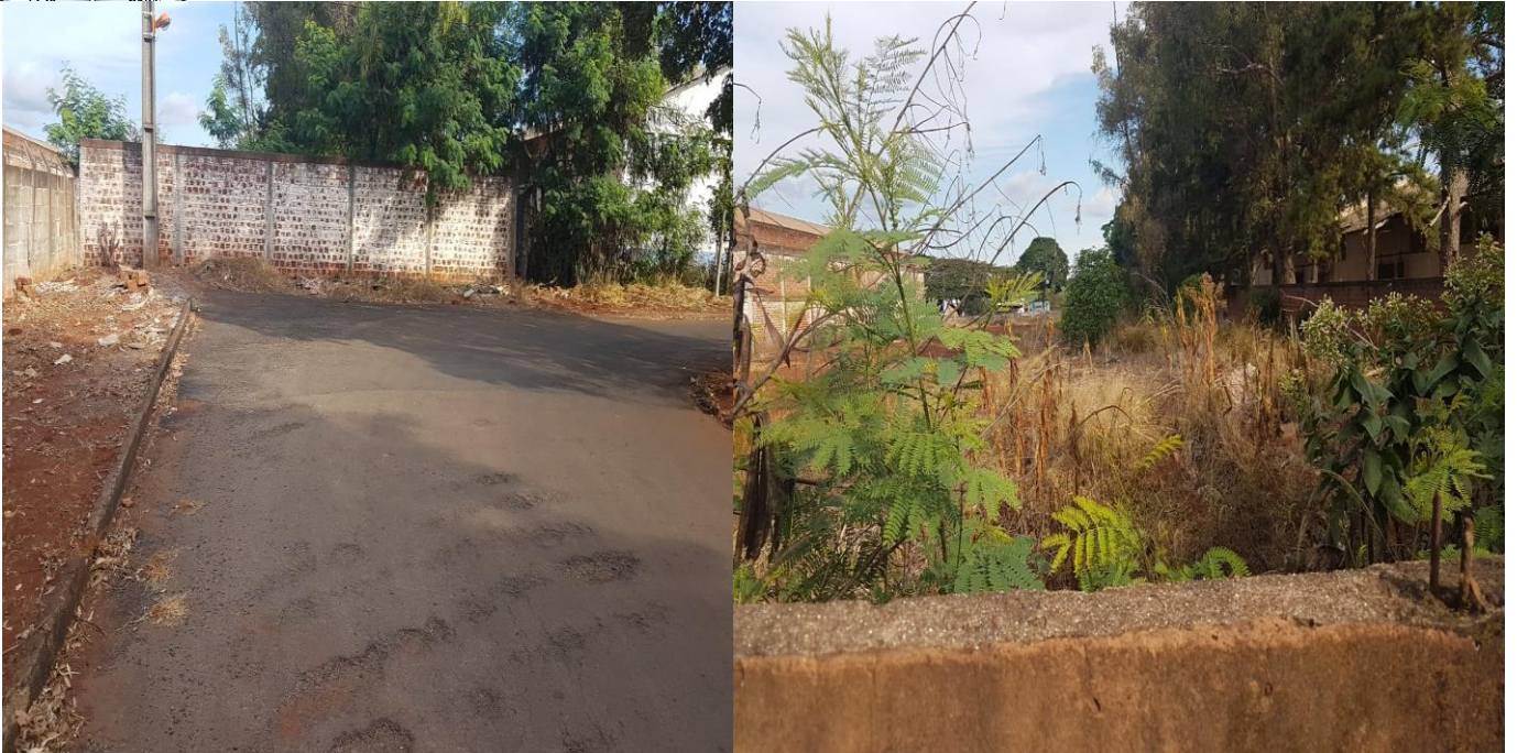
Ponto de interrupção da Rua Lemos do Prado em face da doação.