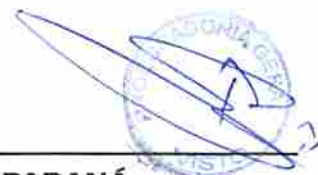
Tauillo Tezelli Prefeito Municipal

PAÇO MUNICIPAL "10 DE OUTUBRO" Campo Mourão, 14 de março de 2019