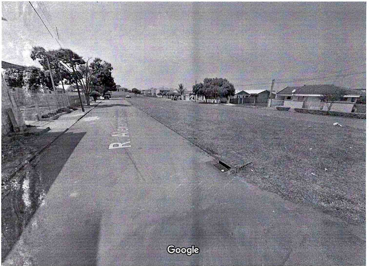
Captura da imagem: set 2011 © 2017 Google

CONSTRUÇÃO DE ACADEMIA DA TERCEIRA IDADE - JARDIM ILHA BELA