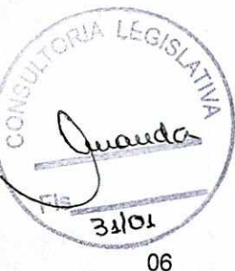
PEDRINHO NESPOLO VEREADOR

SALA DAS SESSÕES DO PODER LEGISLATIVO , em 07 de janeiro de 2013.