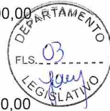
Nelson José Tureck Prefeito Municipal