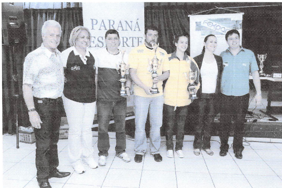
Xadrez Feminino de Campo Mourão recebendo premiação

Data 17/10/2010 20:40:00 | Assunto: Jogos Abertos