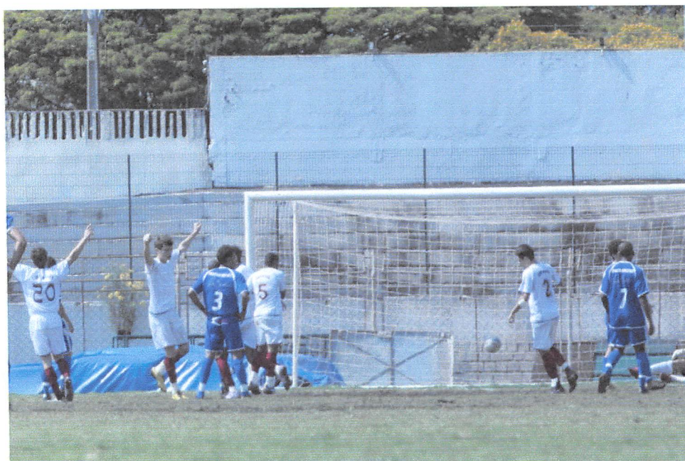
Mourãoenses comemoram gol na final do futebol contra Francisco Beltrão

Confira o desempenho de Campo Mourão por modalidade