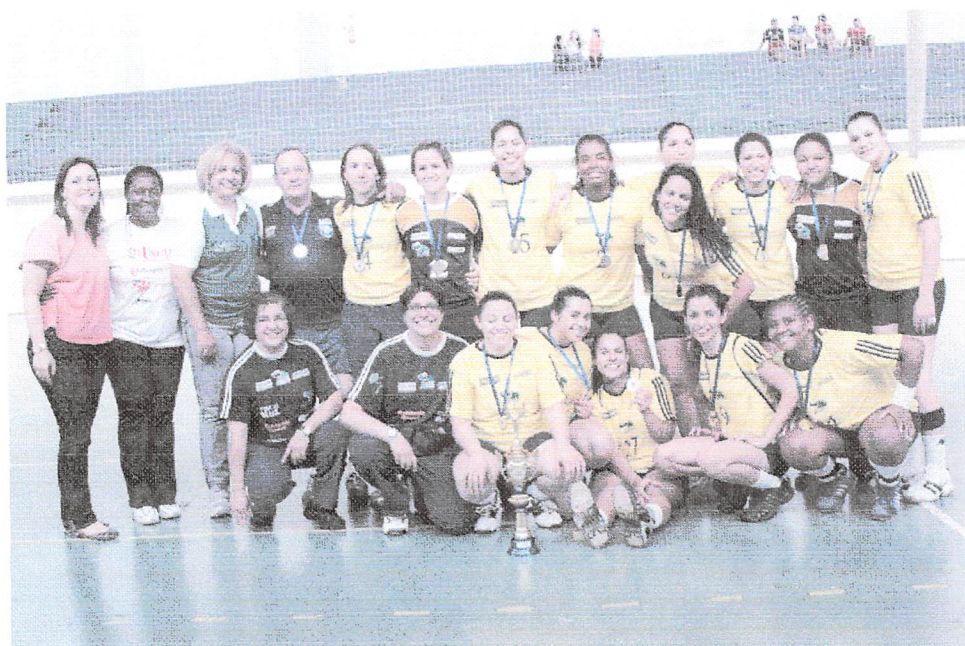
Campo Mourão: campeãs do handebol feminino "B"

1º Maringá – 38 (ouro) 35 (prata) 28 (bronze) – Total: 101