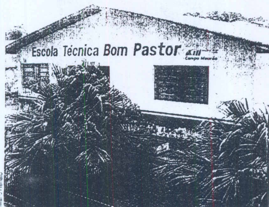
Prédio onde deverá ser instalada a pré-escola