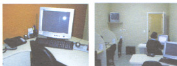
Infraestrutura exclusiva para atendimento via Chat e tutoria