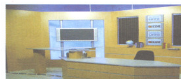
Estúdio do ITDE