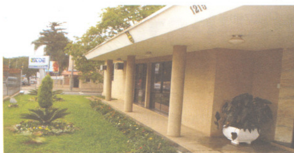
ITDE - sede administrativa em Curitiba