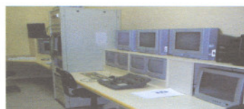
Controle de Som e Imagem