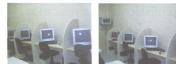
Atendimento via 0800

O ITDE - Instituto Tecnológico de Desenvolvimento Educacional em parceria com a SOCIESC - Sociedade Educacional de Santa Catarina e CENTRO DE EDUCAÇÃO TECNOLÓGICA TUPY e UNDIME-PR, nesta iniciativa, não alcançam apenas benefícios para os jovens estudantes, pois, além dos empregos gerados direta ou indiretamente no desenvolvimento do projeto, também beneficiam toda a região com os investimentos que a mão-de-obra especializada pode trazer para o local.