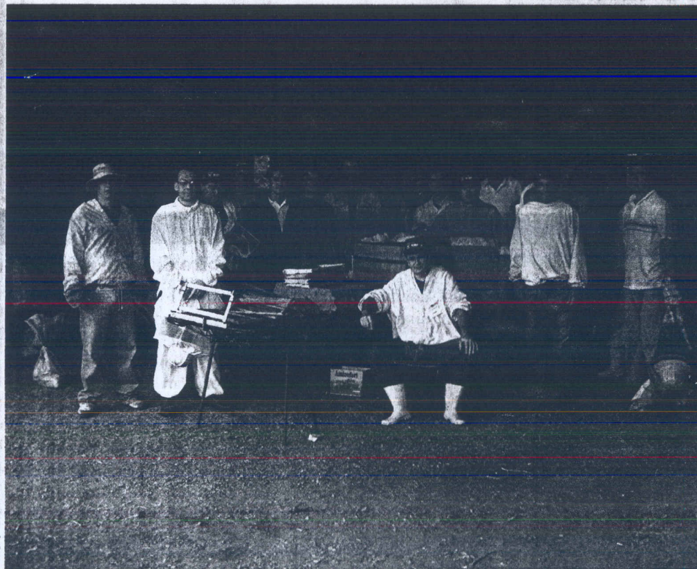
Participaram do curso sobre apicultura, 15 produtores associados da Apromel

Durante a capacitação os produtores receberam informações teóricas e práticas, de como iniciar uma criação, captura de enxames, instalação de apiário, manejo de colméias, fortalecimentos de enxames, alimentação das abelhas, cuidados no inverno, colheita do mel, renovação de caixas, cuidados com os inimigos naturais das