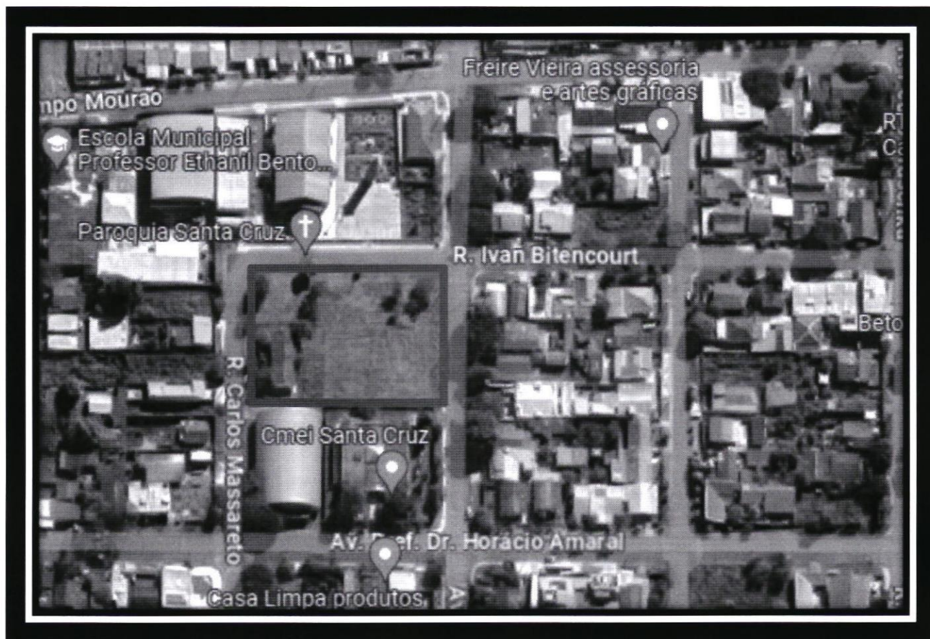
Rua: Yvan Bitencourt, Rua: Carlos Massareto e a Av.: Germano Francisco Rodolfo Bathke – Jardim Santa Cruz.